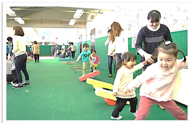
2歳児と母親対象の教室です。 (H25. 4. 2~H26. 4. 1生)