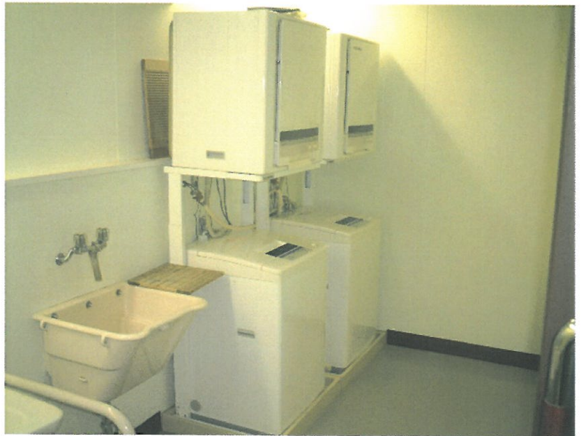
◎ 洗濯機・乾燥機（2台）