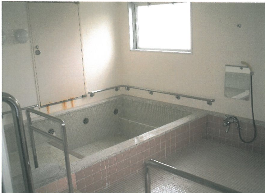
◎ 湯船 サイズ 290×150 8名程度が入れる広さです。