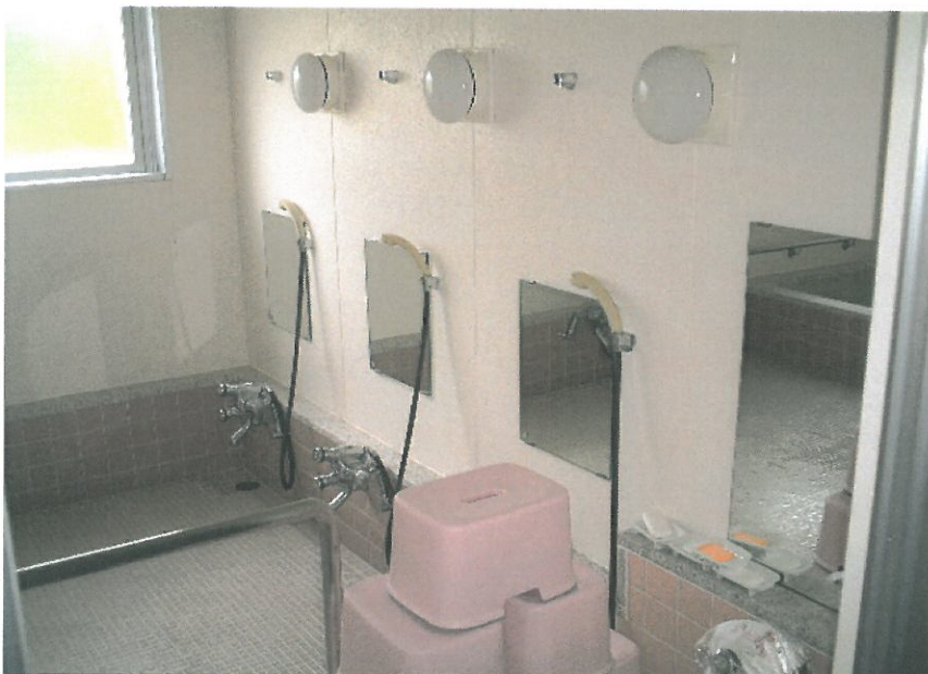
◎ 洗い場は5箇所あります。