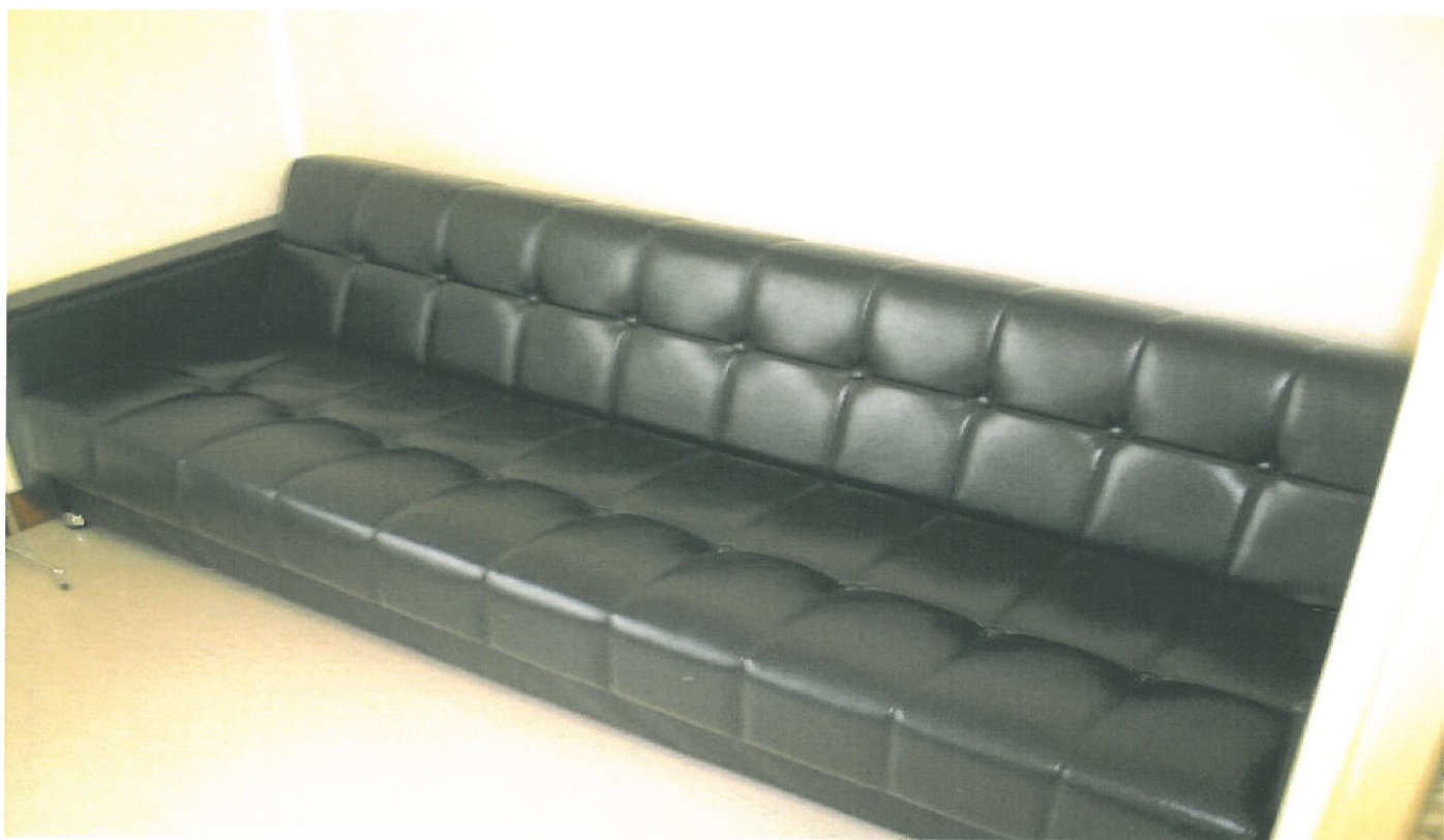
◎ ソファーベッド サイズ 190×90