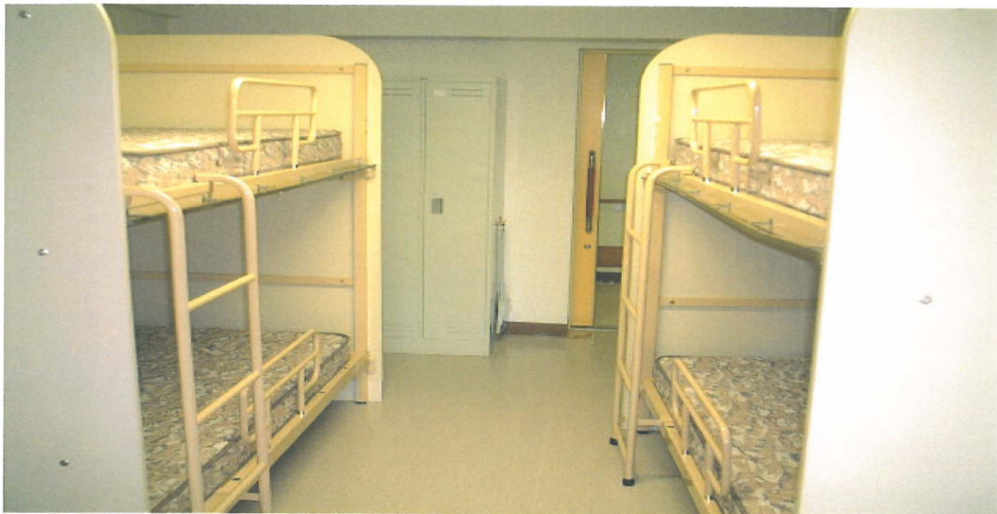
◎ 2段ベッド サイズ 210×110